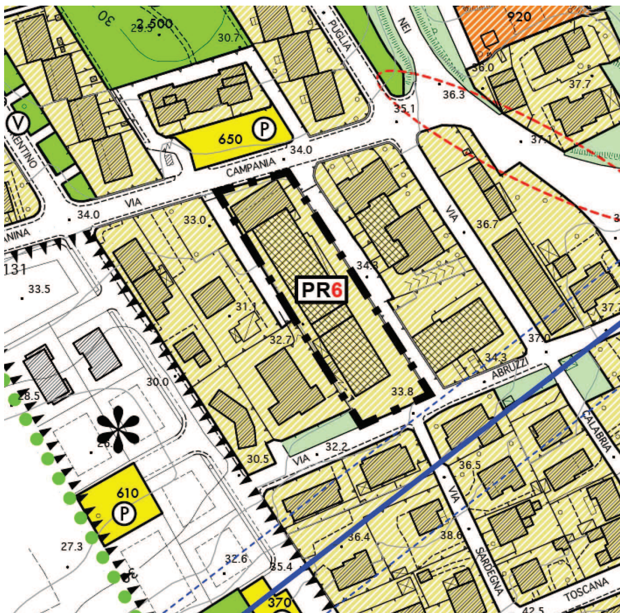
Figura 2 – Stralcio corografico della variante al R.U. proposta

Trattandosi di piano d'intervento conforme alle indicazioni del R.U., non emergono profili di incoerenza o di incompatibilità. Tuttavia la sua attuazione è subordinata a preventiva o contestuale variante allo strumento di governo del territorio ai sensi di legge. In relazione allo snellimento delle procedure perseguite dalle leggi di riferimento (cfr. LL.RR. n. 10/2010 e 65/2014) si propone la necessaria variante al R.U., da adottare e approvare contestualmente al p.a., che si esplica nella mera perimetrazione e nomenclatura del “nuovo” piano come indicato nello stralcio delle figura 2 (PR6).