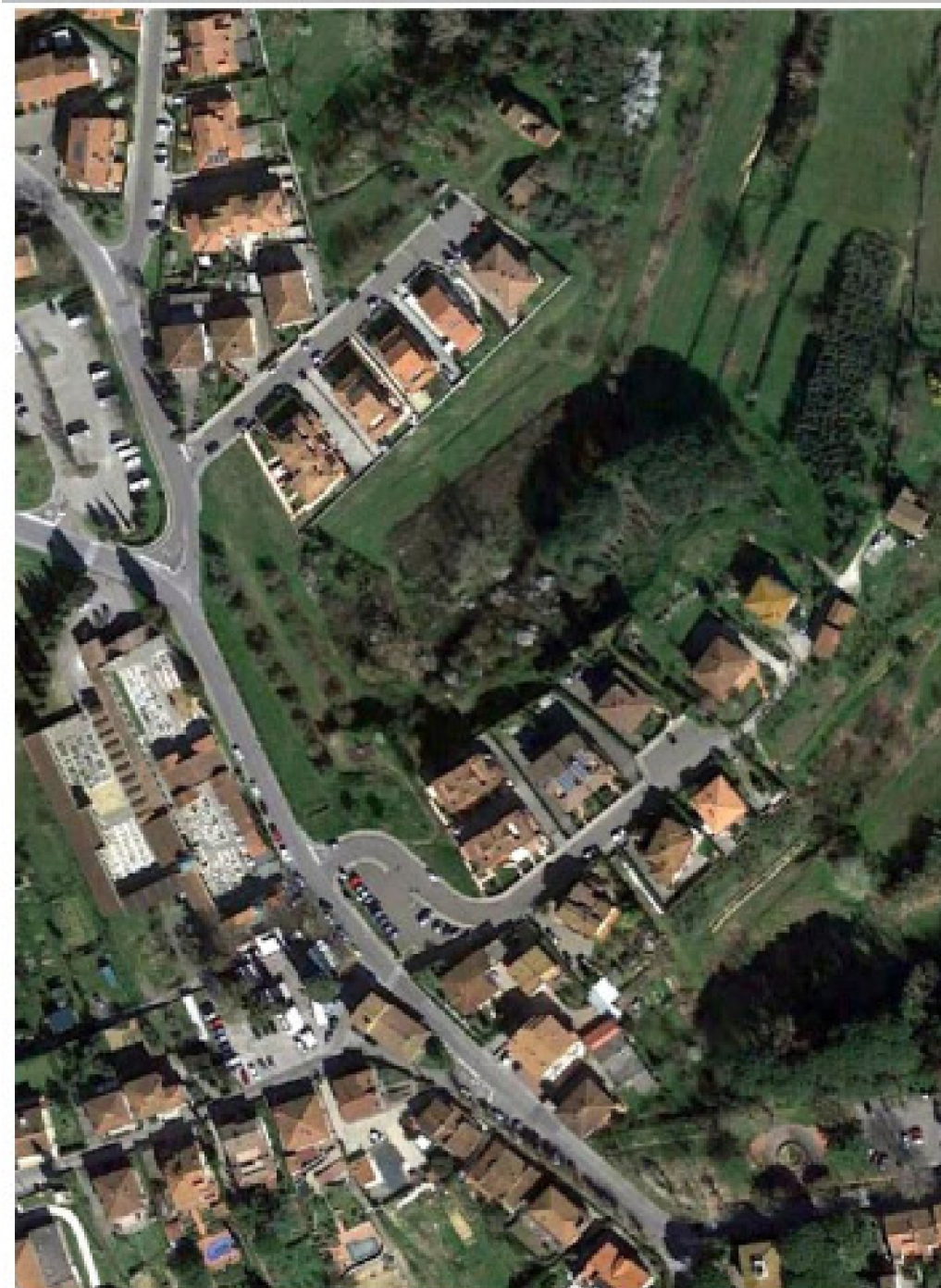
Tavola 1 - R.U.

VARIANTE SEMPLIFICATA EX ART. 30 DELLA L.R. N. 65/2014 AL PIANO STRUTTURALE E AL REGOLAMENTO URBANISTICO PER ADEGUAMENTO LIMITE U.T.O.E. N. 5 "MONTOPOLI" IN FREGIO EX COMPARTO VIA FALCHI/VIA DONATI