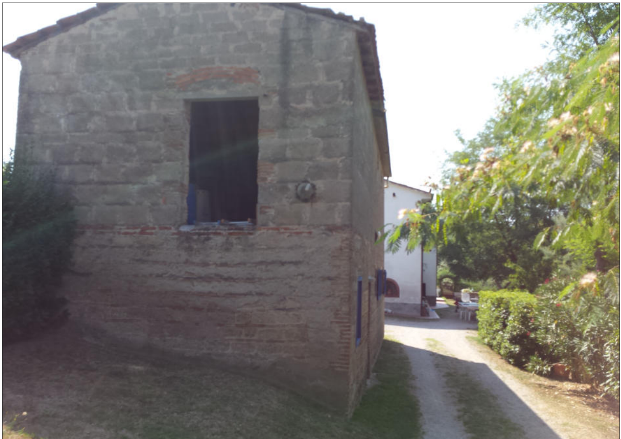
Fabbricato esistente: Vista lato Nord-Ovest