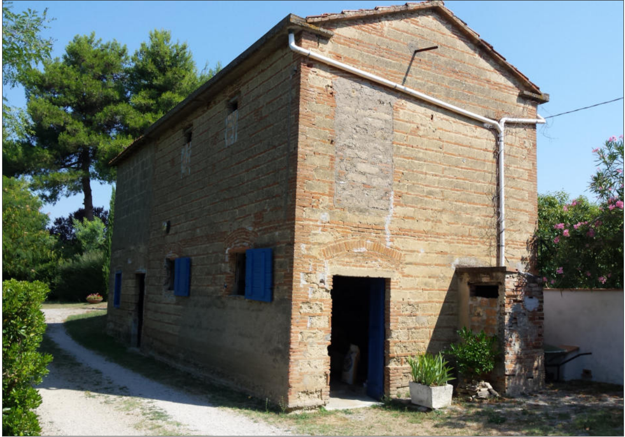
Fabbricato esistente: Vista lato Sud-Ovest