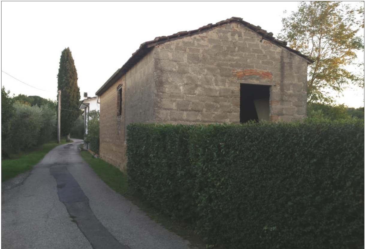
Fabbricato esistente: Vista lato Nord-Est (via Baronci)