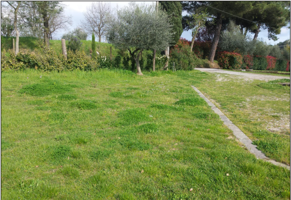
Zona di ingresso del nuovo edificio (vista da Nord-Ovest)