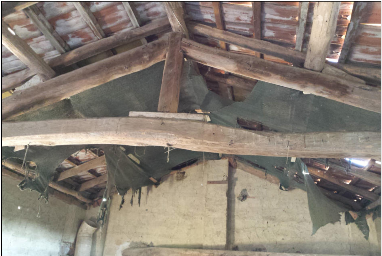
Piano Primo - copertura