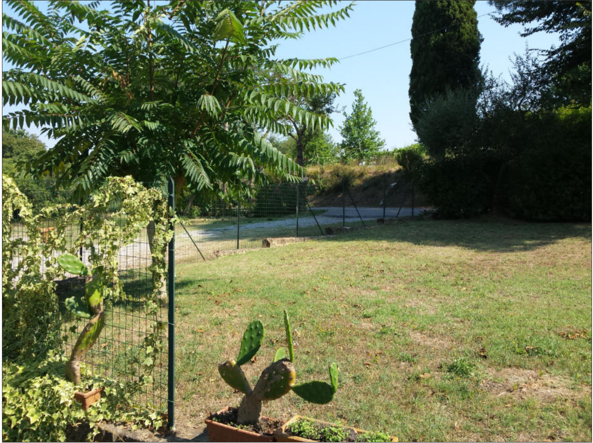
Zona di ingresso del nuovo edificio (vista da Sud)