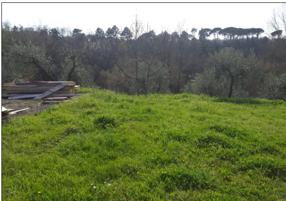
Area di ubicazione del nuovo edificio (vista da Est verso Ovest)