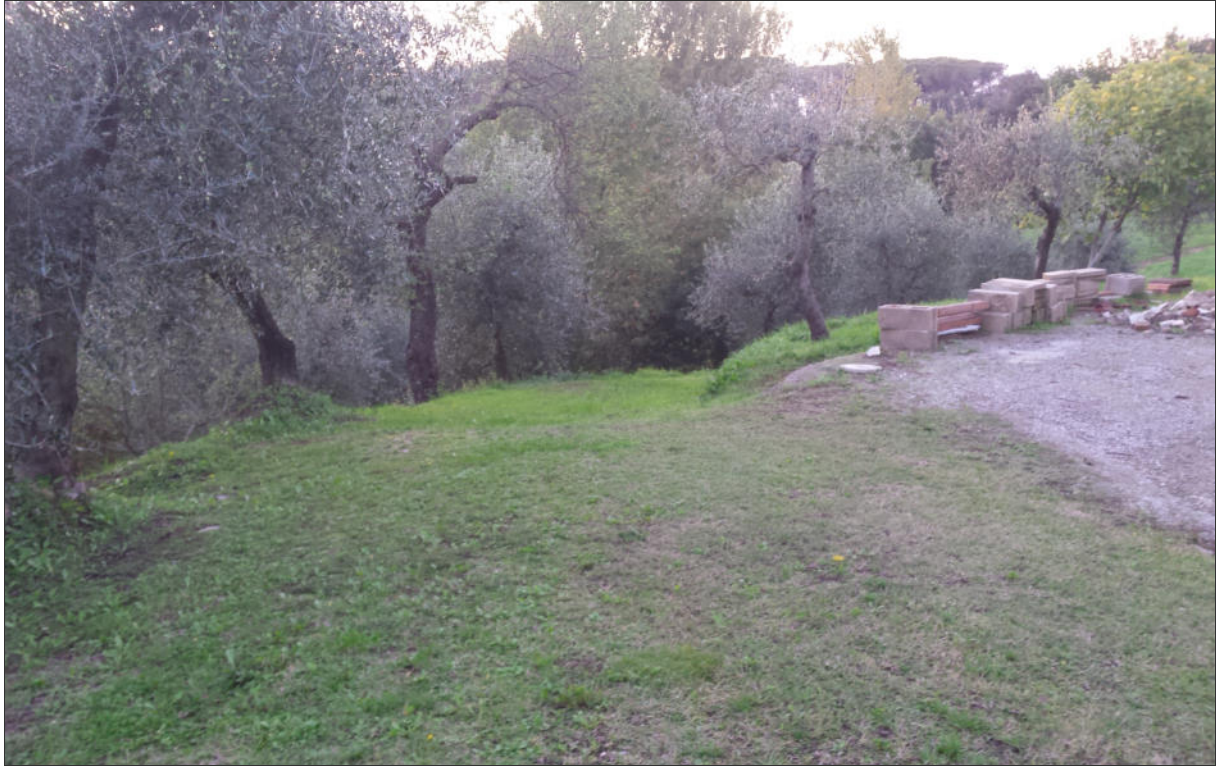
Area di ubicazione del nuovo edificio (rampa di discesa)