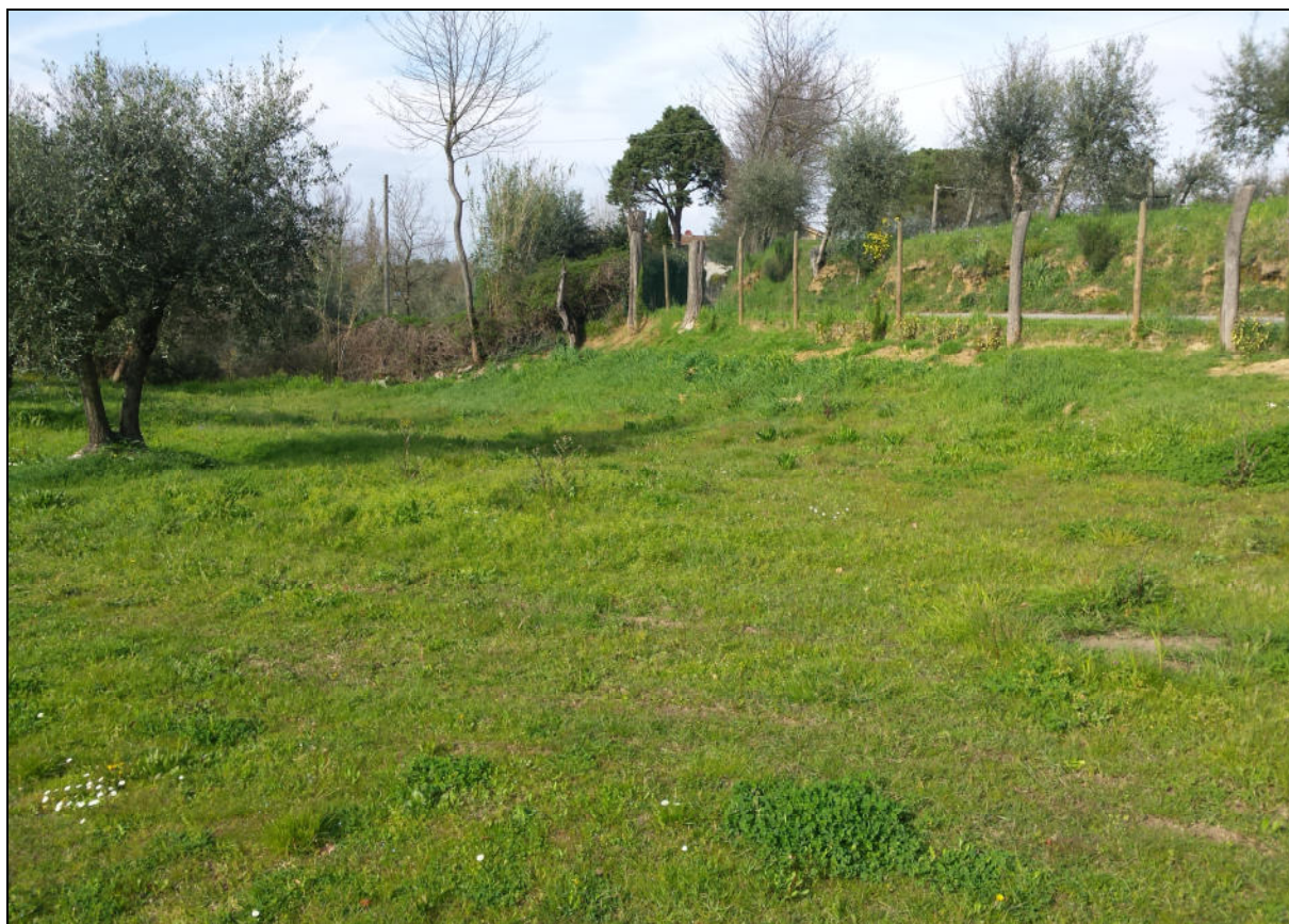
Resede zona piscina (vista da Sud verso via Baronci)