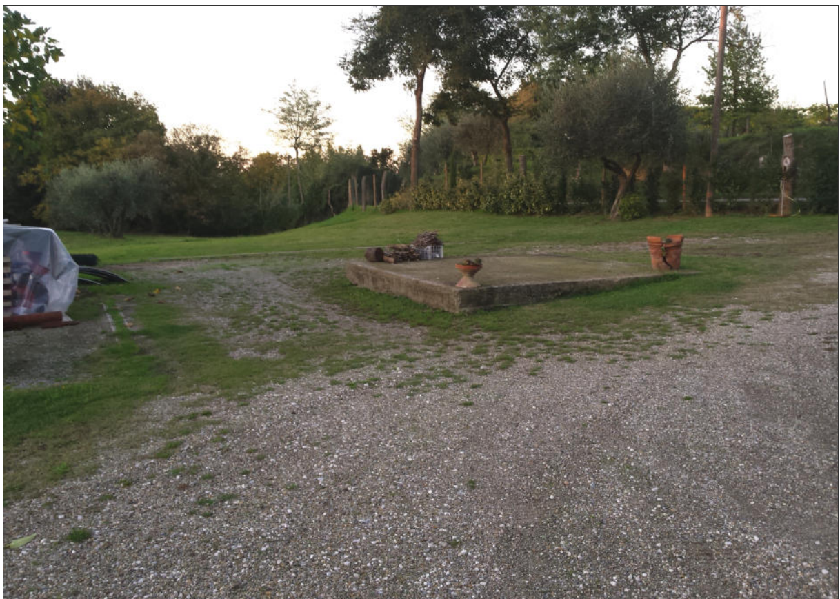
Area di ubicazione del nuovo edificio