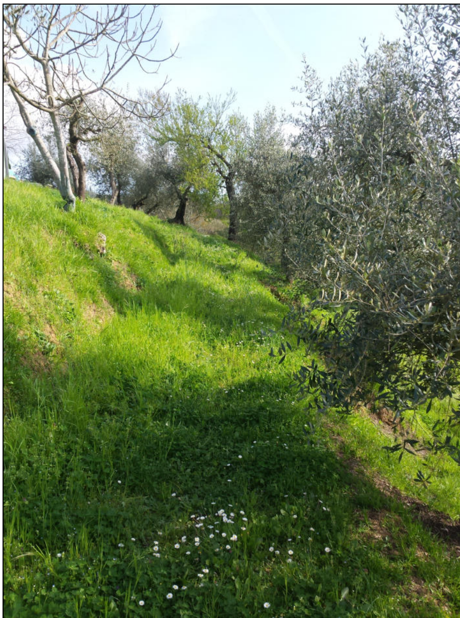
Zona di ingresso al futuro piano interrato (vista da Ovest)