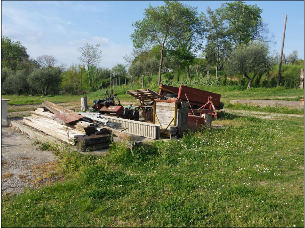
Area di ubicazione del nuovo edificio (vista da Sud)