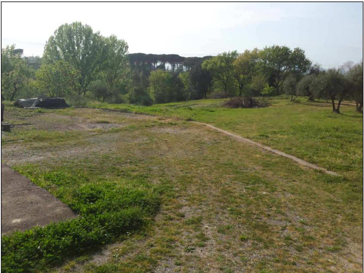
Area di ubicazione del nuovo edificio (vista da Sud)