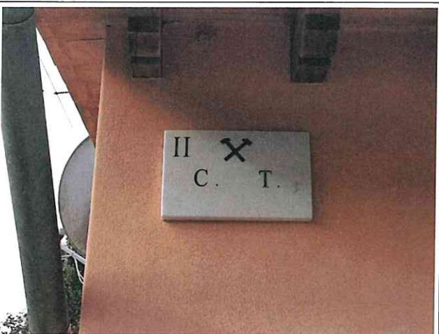
Targa n.II Strada Provinciale 39, località San Lorenzo cap:56020 Montopoli in Val d'Arno PI