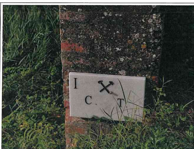
Targa n.I Strada Provinciale 39, in prossimità del ponte sul Torrente Chiecina cap:56020 Montopoli in Val d'Arno PI