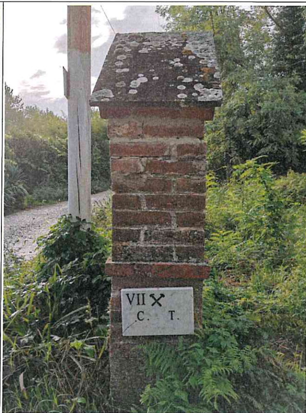
Targa n.VII cap:56020 Montopoli in Val d'Arno PI

A conclusione del verbale si può chiaramente affermare che la documentazione fornita a corredo della richiesta di concessione, relativa all'area di coltivazione della "Sorgente Tesorino" corrisponde alla realtà sopra sintetizzata.