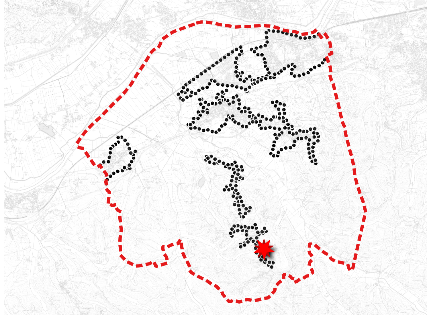
TAVOLA 14 - STATO ATTUALE