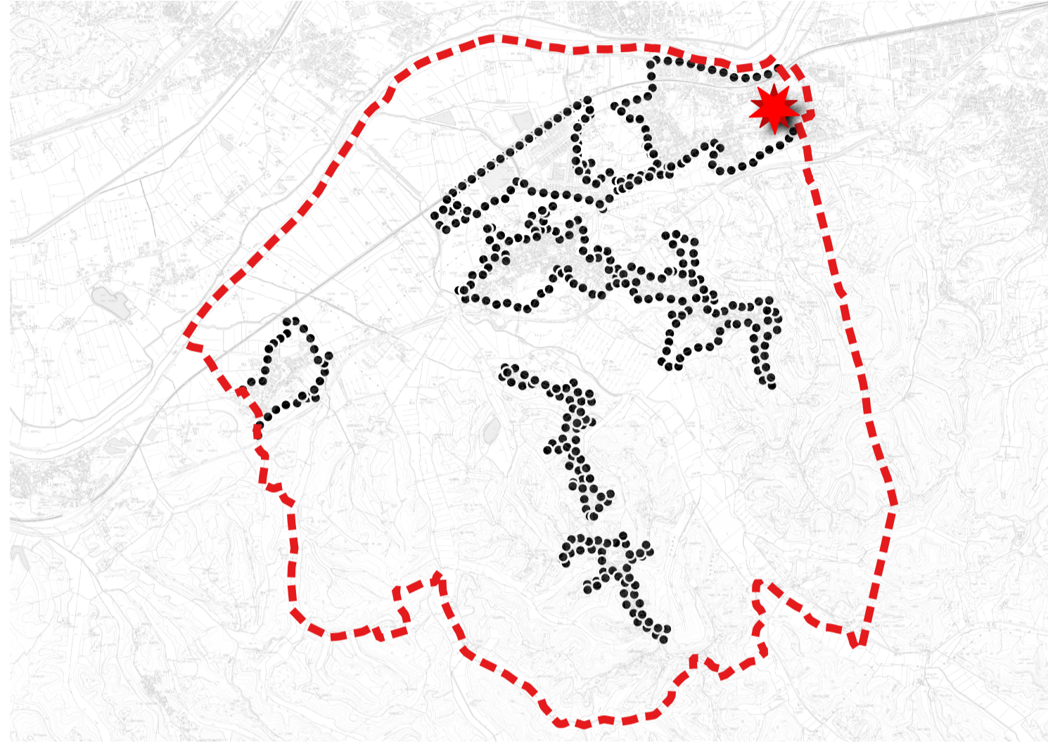
TAVOLA 9 - Scala 1:2000 Approvazione delibera C.C. n.32 del 9/11/2023