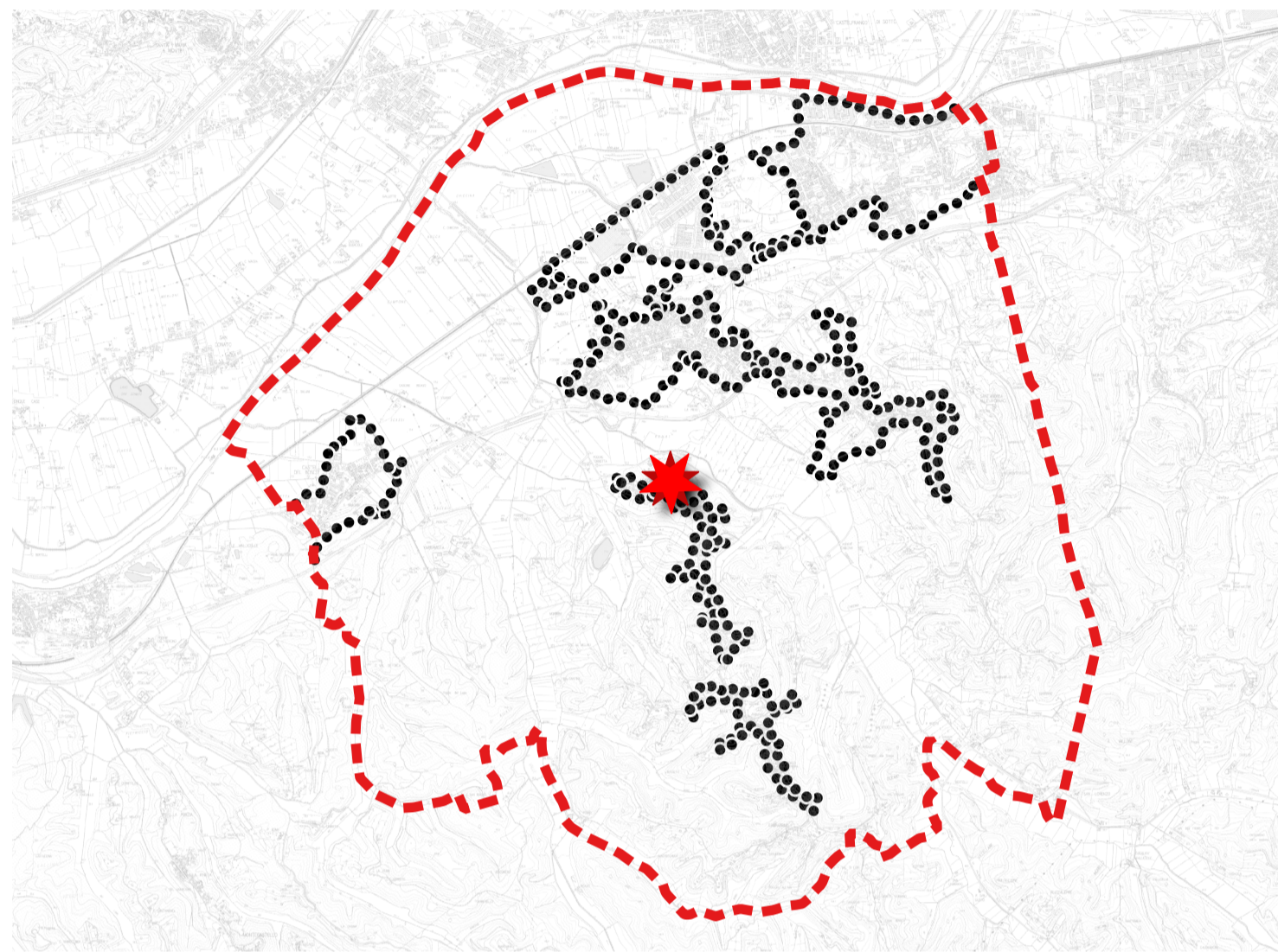
TAVOLA 12 - STATO ATTUALE - 1.2.000